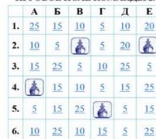
ИГРОВОЕ ПОЛЕ КОМАНДЫ 2.